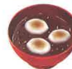
※写真はイメージ図です。

※ご飲食は決められた場所(飲食エリア)にてお願いいたします。(おのえ住民自治協議会)