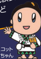
武四郎まつりマスコット キャラクター たけちゃん

松浦武四郎記念館 および 誕生地 ※松浦武四郎記念館および誕生地の入館料も無料 国の重要無形民俗文化財に指定され、 ユネスコの無形文化遺産に登録された アイヌ古式舞踊をご覧いただけるほか、 アイヌ文様の切り絵や民族衣装の試着が できる体験コーナーなど