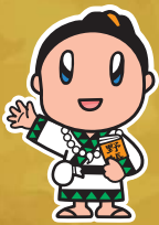
松浦武四郎 生誕200年記念事業 PR隊長 たけちゃん

本フォーラムは、みなさんとともに武四郎に「触れ」、武四郎を「語り」、武四郎を「知る」、いわば「武四郎の集い」です。武四郎に傾倒する著名人や研究者のお話を通して、武四郎の生き方を知り、考え方を探る機会となれば幸いです。